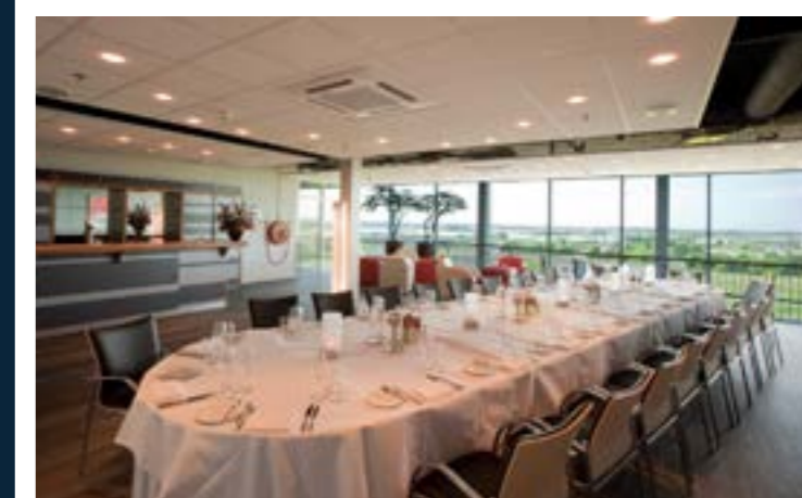
PENTHOUSE VOOR BIJZONDERE (NETWERK)BIJENKOMSTEN