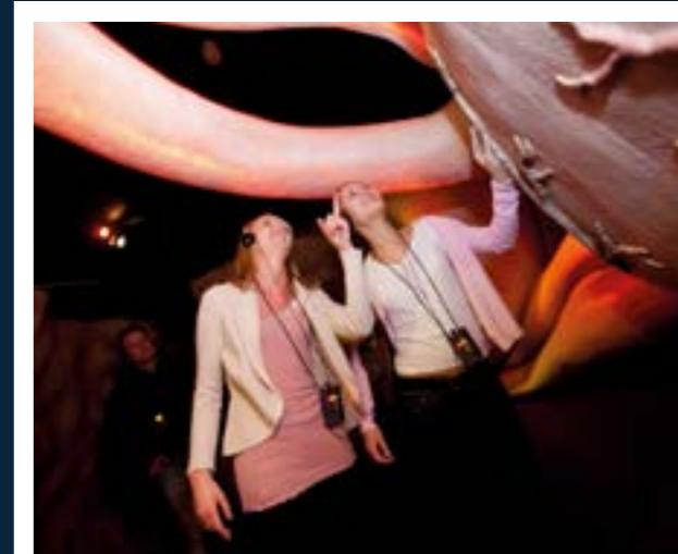
EDUCATIE: REIS DOOR HET MENSELIJK LICHAAM