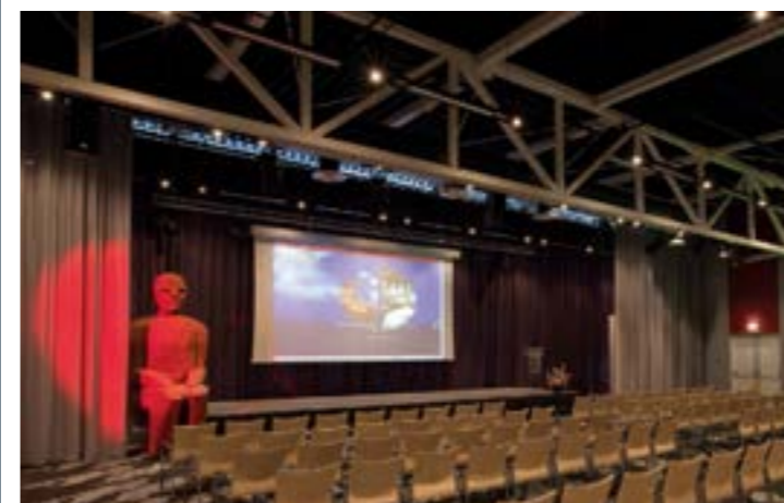
CONGRESZAAL VOOR 300-540 GASTEN