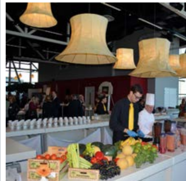
RUIME, LICHT Foyer MET TERRAS